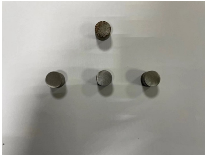
TJA20201101-1256 试验后试块照片 (气相缓蚀能力)